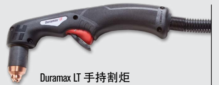
Duramax LT 手持割炬